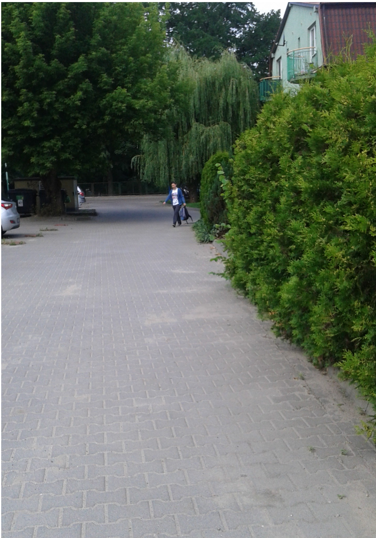
Fot. 3 – Widok terenu (w kierunku studni S1)