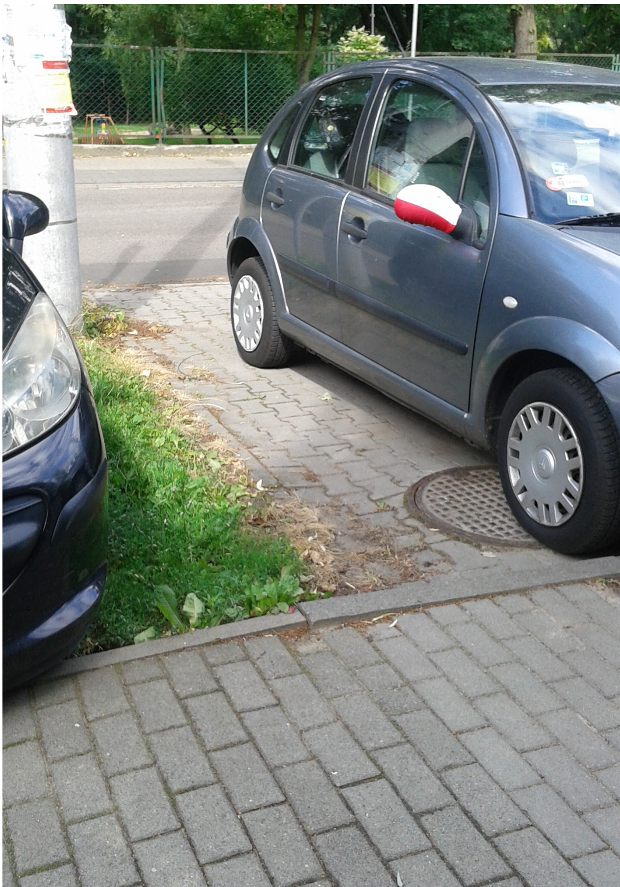
Fot. 1 - Studzienka S1