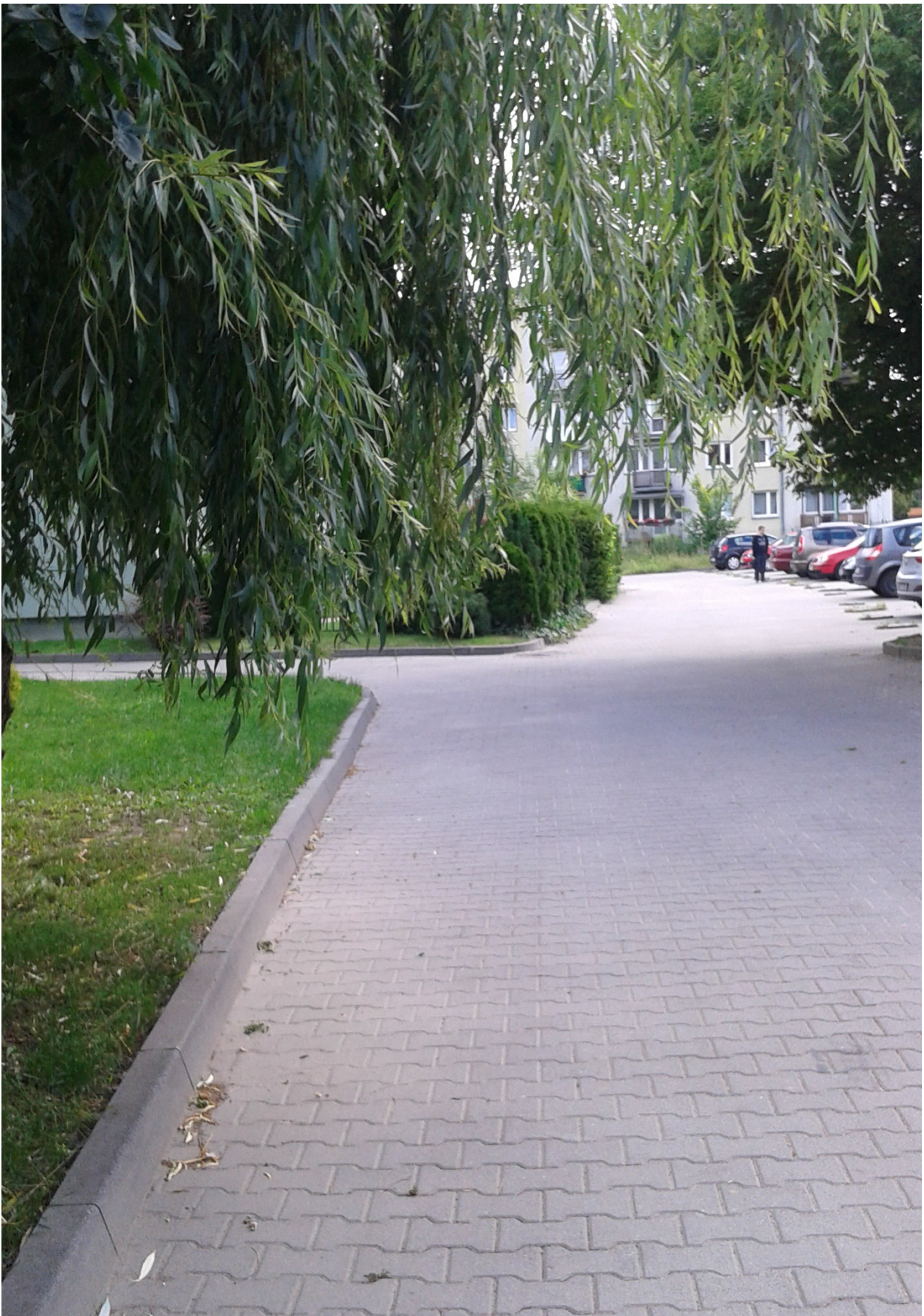
Fot. 4 – Widok terenu (w kierunku studni S2)