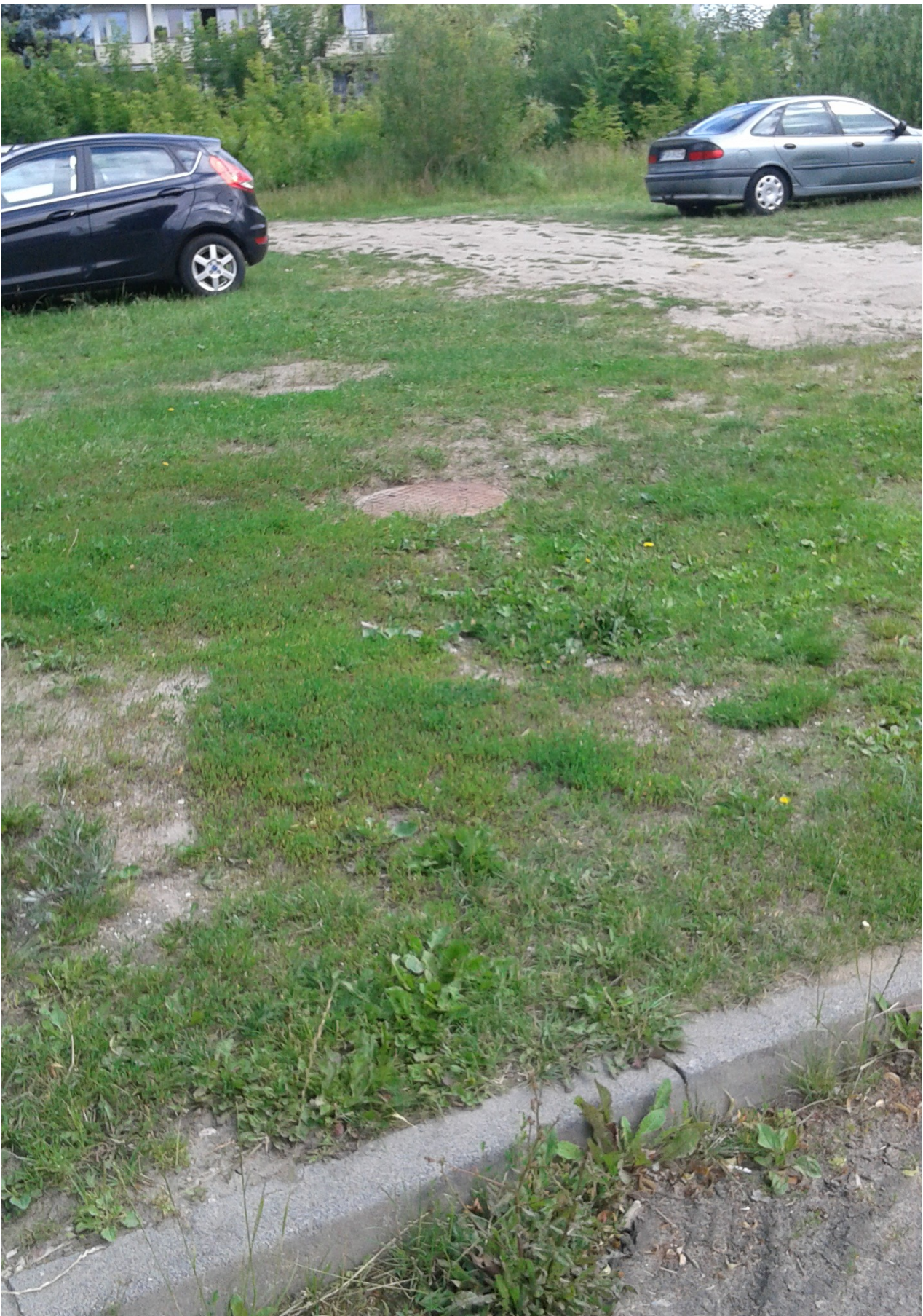
Fot.2 - Studzienka S2